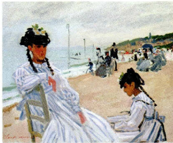
クロード・モネ《トルヴェールの海辺にて》1870年 油彩、カンヴァス 38×46cm