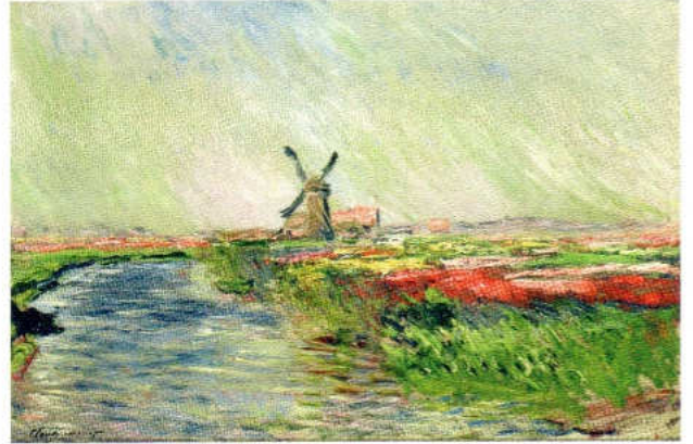
▲クロード・モネ《オランダのチューリップ畑》1886年 油彩、カンヴァス 54×81cm