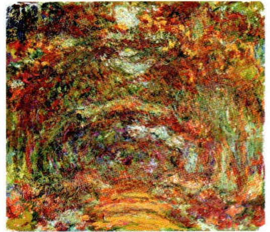
クロード・モネ《ひらの小池、ダヴルニー》1920-22年 油彩、カンヴァス 89×100cm